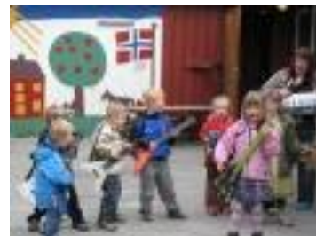
Leikskólinn Njálsgötu, Sameinaðir sem einn strengur

Menntasvið Reykjavíkurborgar og nokkrir skólar í Reykjavík fóru í samstarf með sambærilegri stofnun og skólum á Spáni. Verkefnið SPICE (Students, Parents, Interculture, Community and Education). Markmið verkefnis er að bæta stefnu og starfshætti verðandi aðlögun nýbúa/innflytjenda í skólasamfélagið.